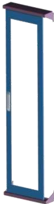
Tür perforiert – Typ 1