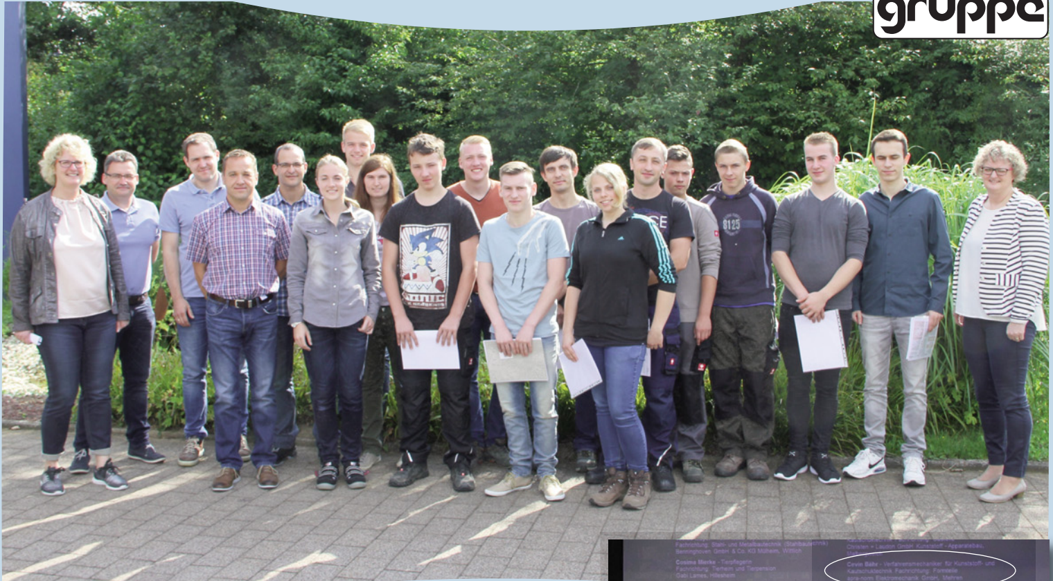
Auszubildende der apra-gruppe 2016