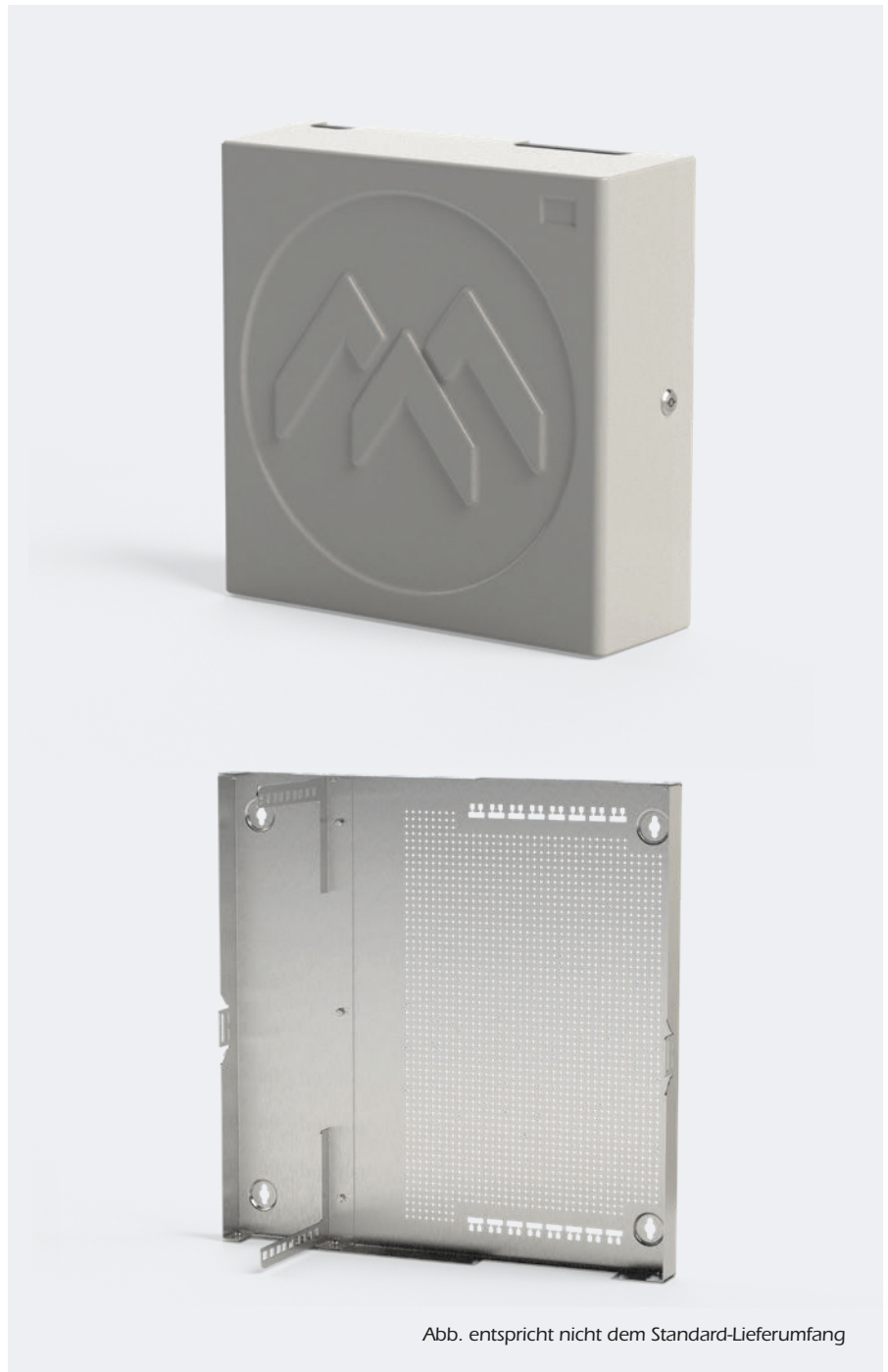
Abb. entspricht nicht dem Standard-Lieferumfang