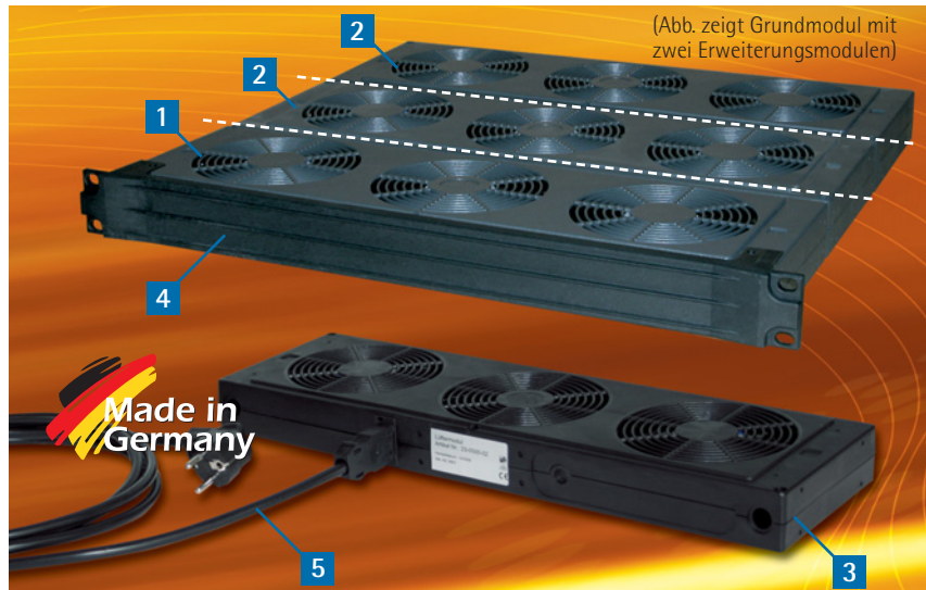
(Abb. zeigt Grundmodul mit zwei Erweiterungsmodulen)

Das Lüfter-Erweiterungsmodul ist ebenfalls als 1-, 2- oder 3-fache Einheit erhältlich und stellt eine steckbare mehrfache Erweiterung des Lüftergrundmoduls dar. Die mechanische Verbindung der Module erfolgt über Aluminium-Führungsbolzen (im Lieferumfang enthalten). Auf der Frontseite ist das Erweiterungsmodul mit einem Stecker, auf der Rückseite mit einer Buchse ausgestattet. So wird durch das Anreihen automatisch die elektrische Verbindung zwischen den Modulen hergestellt.